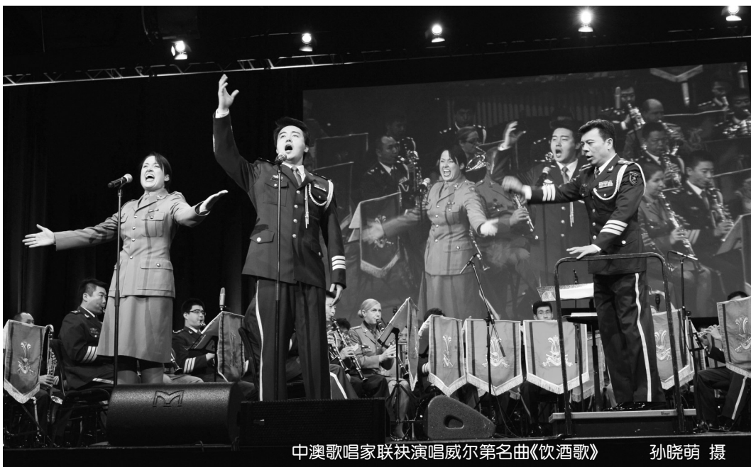
中澳歌唱家联袂演唱威尔第名曲《饮酒歌》