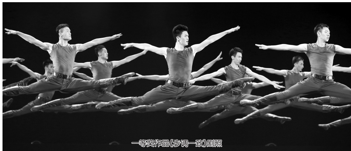
一等奖作品《步调一致》剧照

我同样会常常想起自己在4年连队指导员任期里带过的那些兵。我和他们处得不错,所以每年冬天老兵复员以后,我都会有几天缓不过劲来。他们走后留下的岗位空缺,几个月后就会被新兵一一接替,但他们走后留下的情感空缺,却永远无法像拼图那样被严丝合缝地填补。每个兵都是不同的,他们的面孔和灵魂都是这个世界上唯一的。每个人都是不可替代的那个人。而对我来说,他们永远是鲜活的,不论是过去还是现在,也不论我喜欢谁还是讨厌谁。离开连队10年,我已经失去他们当中大多数人的消息,但也许还会在我的小说里重新出现。古人说,千军易得,一将难求,但我并不这么认为。我始终觉得,这些沉默寡言的士兵,才是这支军队真正的脊梁,也就是军事文学永远的主角。