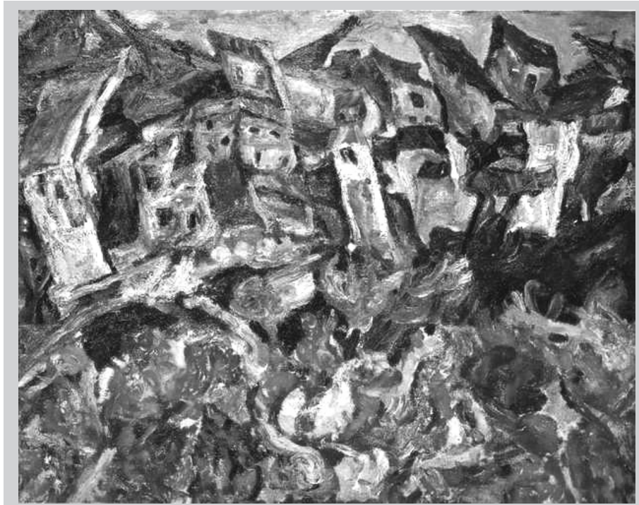
法国画家柴姆·苏丁作品