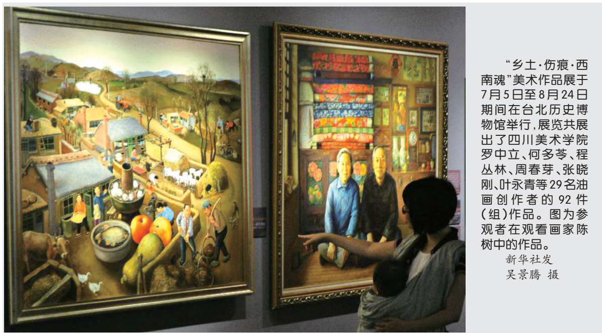
“乡土·伤痕·西南魂”美术作品展于7月5日至8月24日期间在台北历史博物馆举行,展览共展出了四川美术学院罗中立、何多苓、程丛林、周春芽、张晓刚、叶永青等29名油画创作者的92件(组)作品。图为参观者在观看画家陈树中的作品。

会议提出,上海广大的网络作家应增强社会责任意识,遵守国家的法律、法规和政策,遵守社会道德风尚,加强学习,努力提高自身修养,不断提升文本质量。创作中注重人文关怀,强化精品意识,有梦想,有追求,努力创作出无愧于时代、无愧于人民的健康向上的网络文学作品,促使网络文学作品在为人民群众提供丰富精神食粮的同时,成为社会积极向上的精神引导力量,为实现中华民族伟大复兴的中国梦贡献力量。(欣 闻)