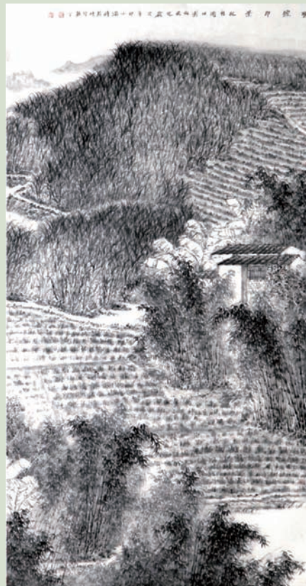
那墟即景 熊丁(壮族)