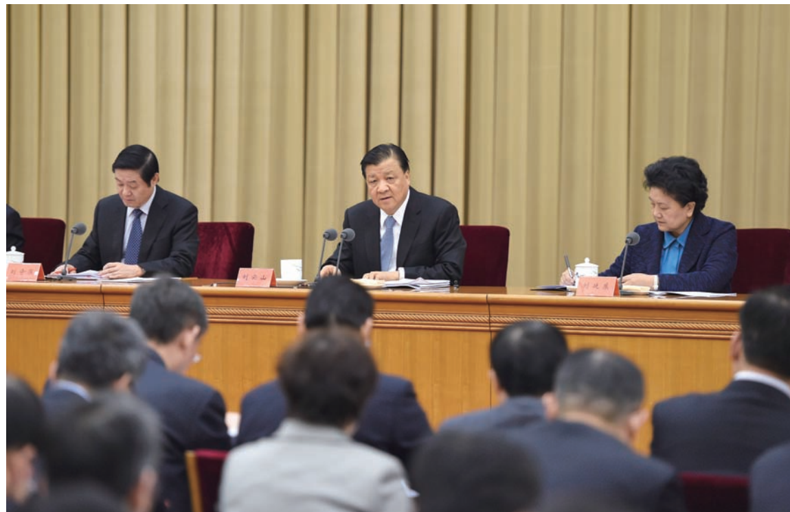
1月5日,全国宣传部长会议在北京召开。中共中央政治局常委、中央书记处书记刘云山出席并讲话。

议并作工作部署,强调要把握正确导向,坚持价值引领,讲好中国故事,强化依法管理、奋力创新求进。要深入学习宣传贯彻习近平总书记系列重要讲话精神,深化中国特色社会主义和中国梦学习宣传教育;强化党委领导意识形态工作责任制,牢牢掌握意识形态领域的领导权主动权;推进社会主义核心价值观学习教育实践具体化系统化,努力在全社会形成共同的价值