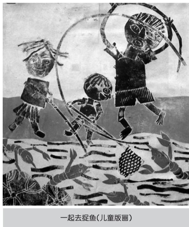
一起去捉鱼(儿童版)