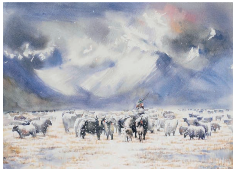
圣地银装(水彩) 王海作