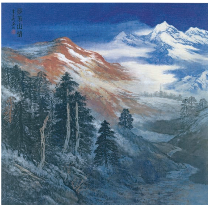
梦笔山情(国画) 李呈修作