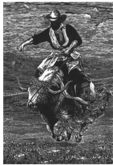
转山(木刻版画) 李晓刚作