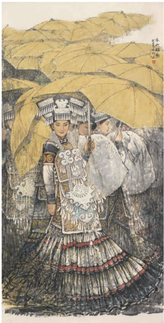
凉山路歌(国画) 杨循作