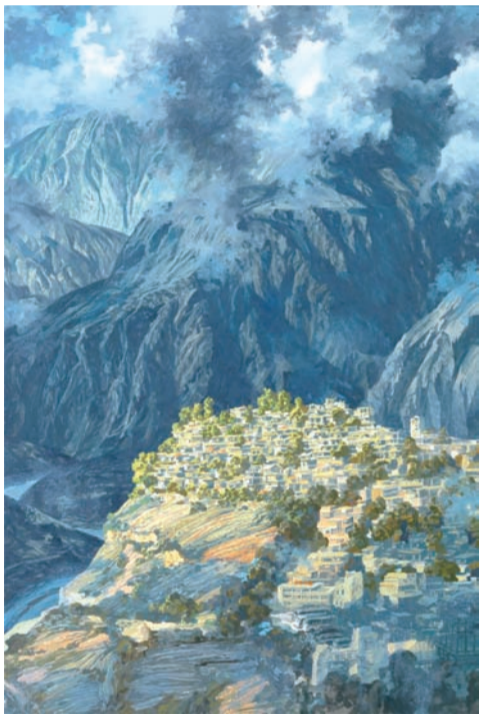
云上的街市——萝卜寨(油画) 何冠霖作