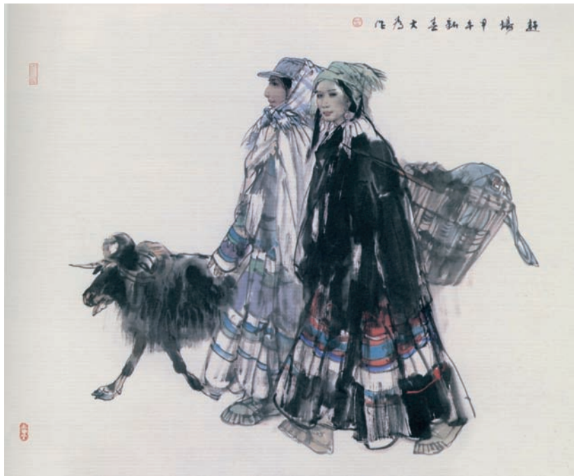
赶场(国画) 刘大为作