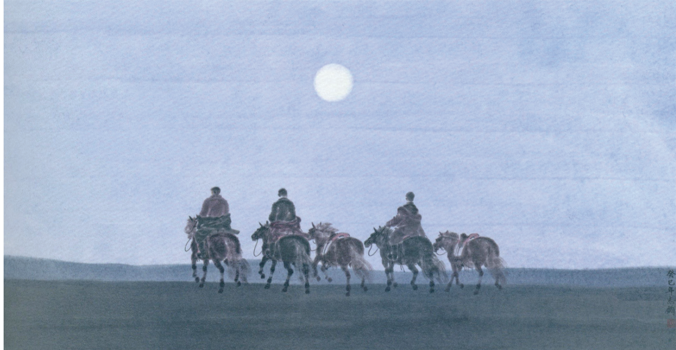
草原行旅(国画) 孙志均作