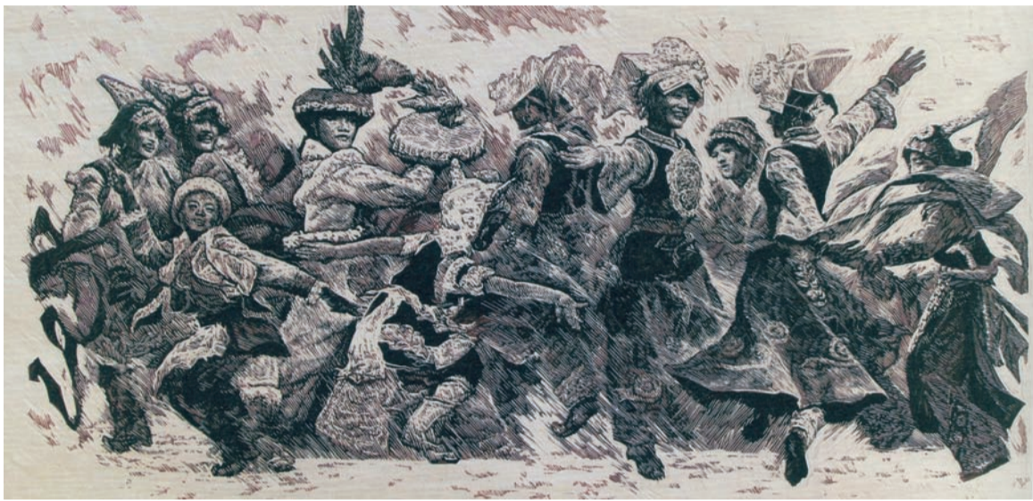
羌之舞(木刻版画) 武海成作