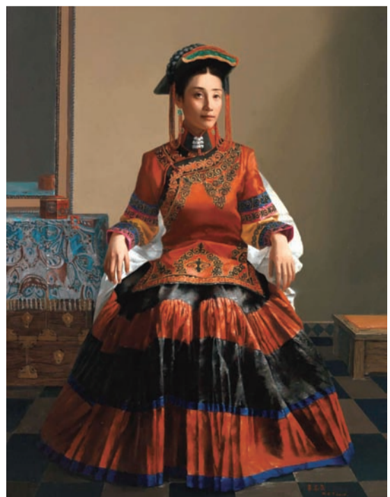
穿盛装的彝族姑娘(油画) 辜志勇作