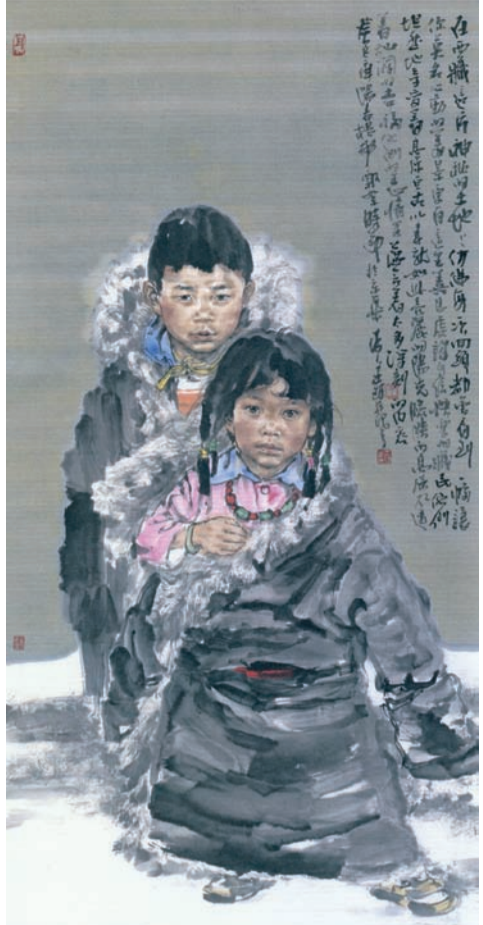
藏族娃(国画) 王珂作