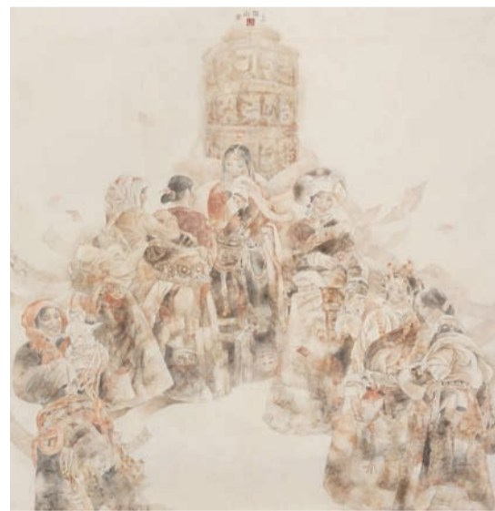
东山顶上(国画) 华林作