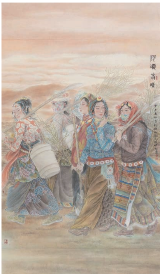
阿坝春晴(国画) 罗智慧作