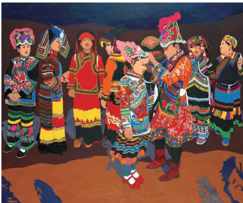
又是一年花季(油画) 吕涛作