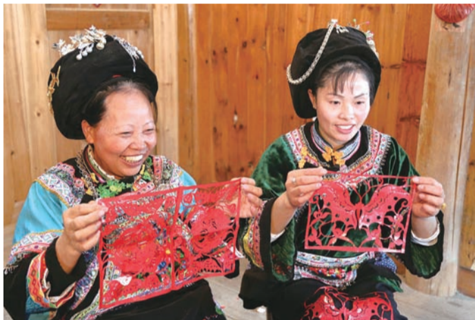
展示水族剪纸作品