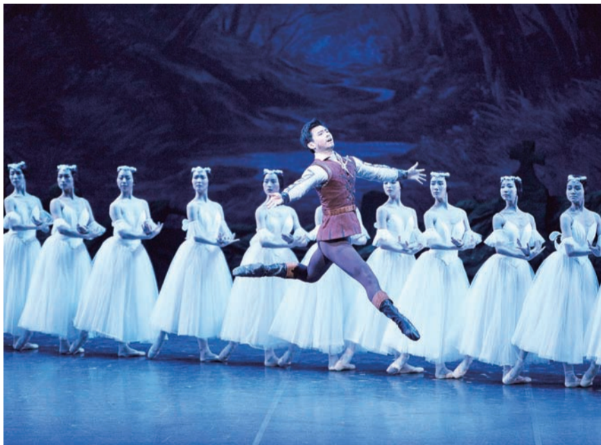
12月4日,中国国家芭蕾舞团古典芭蕾舞剧《吉赛尔》在国家大剧院上演,标志着为期两个多月的2015国家大剧院舞蹈节精彩收官。本届舞蹈节共有19台、44场高水准的舞蹈演出,来自中外7个国家和地区的14支顶级舞蹈团体轮番登场,谭元元、希薇·纪莲、乌里安娜·洛帕特金娜等众多世界舞坛明星纷纷亮相,给观众带来唯美的艺术享受。图为《吉赛尔》剧照。