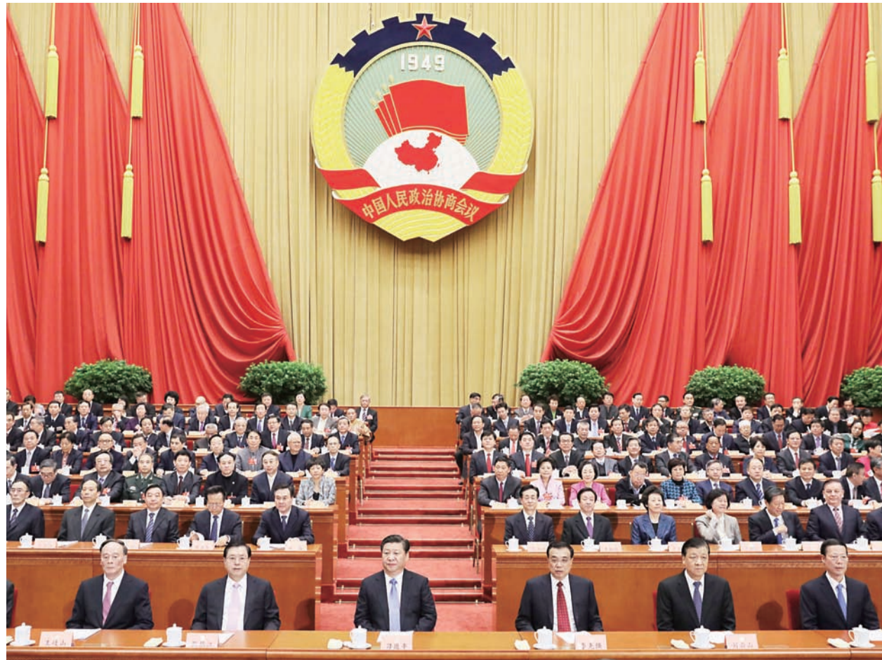
3月14日，中国人民政治协商会议第十二届全国委员会第四次会议在北京闭幕。这是习近平、李克强、张德江、刘云山、王岐山、张高丽等在主席台就座。