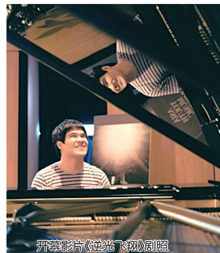
开幕影片《逆光飞翔》剧照

中国台湾青春励志电影《逆光飞翔》和微电影《一维》成为本届电影节开幕影片。其中,《逆光飞翔》由王家卫出品、金马奖最佳新人导演张荣吉执导,改编自台湾首位盲钢琴家黄裕翔的真人真事,影片凭借唯美、动人的影像和温暖、催泪的故事,先后获得多个国际电影奖项。这次提前半月在北京大学生电影节上展映是首次在中国大陆公映。《一维》由吕乐执导,是“优酷出品大师微电影”系列之一。该片改编自鹿桥的小说集《人子》,是一部具有佛教寓意的故事短片,以古喻今,开放式探讨如何分辨人性的善恶。