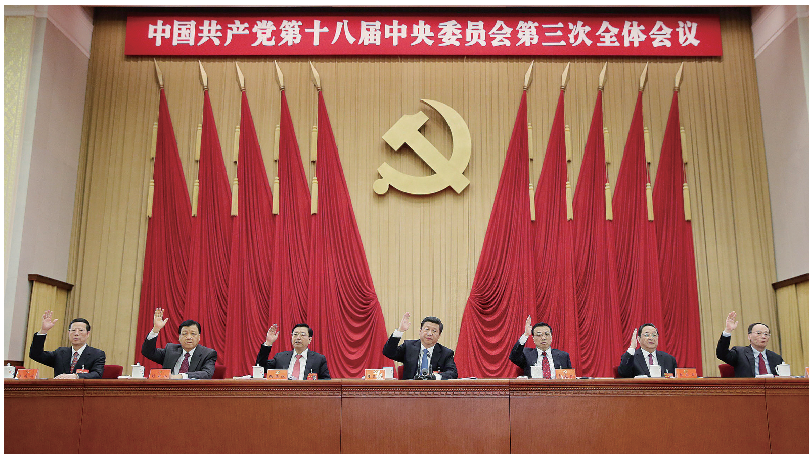
中国共产党第十八届中央委员会第三次全体会议，于2013年11月9日至12日在北京举行。这是习近平、李克强、张德江、俞正声、刘云山、王岐山、张高丽在主席台上。