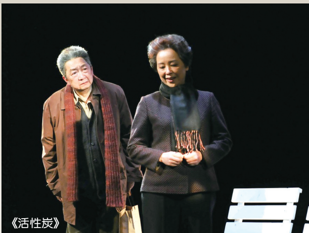
上海话剧艺术中心三台剧目赴京演出引热议——