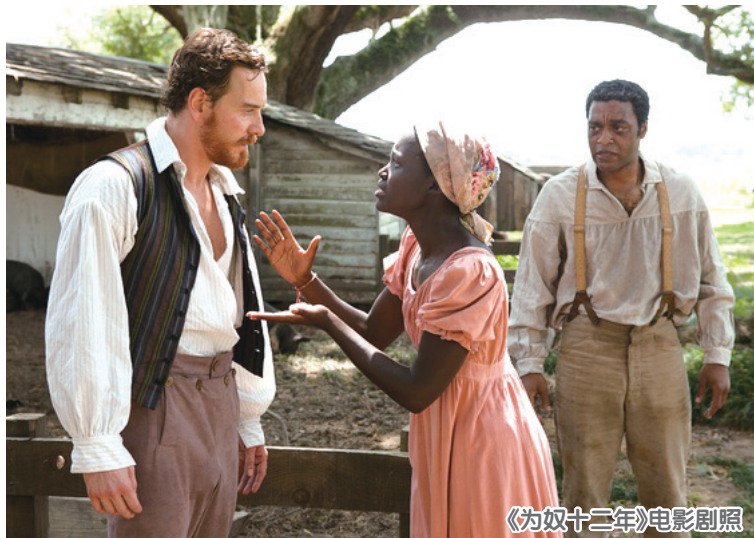
《为奴十二年》电影剧照