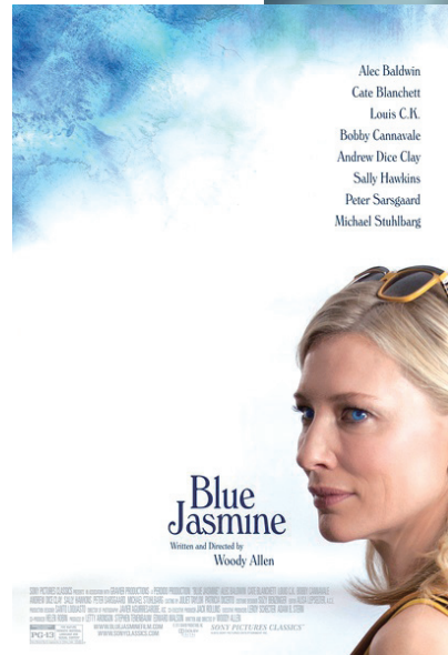
《蓝色茉莉》电影海报

义这些标准生活的,例如,时尚杂志、电视广告所渲染的“成功人士”的生活图景,就会成为想进入更高层次的人群的教科书,有时候他们会模仿得惟妙惟肖。